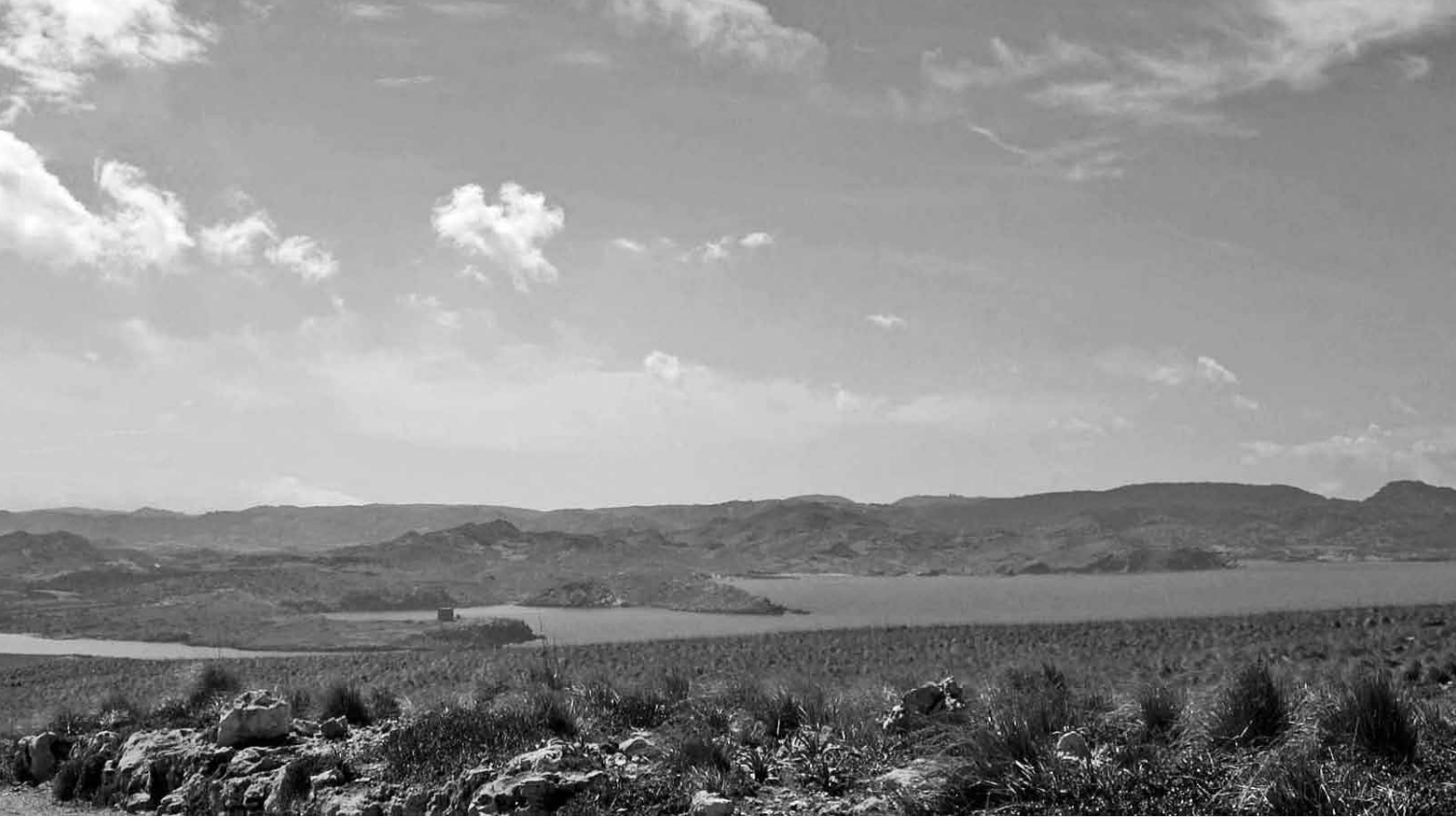
Panoràmica reserva marina

de la protecció, mostrar-li els recursos ocults sota l'aigua i la biodiversitat que alberguen els ecosistemes marins.