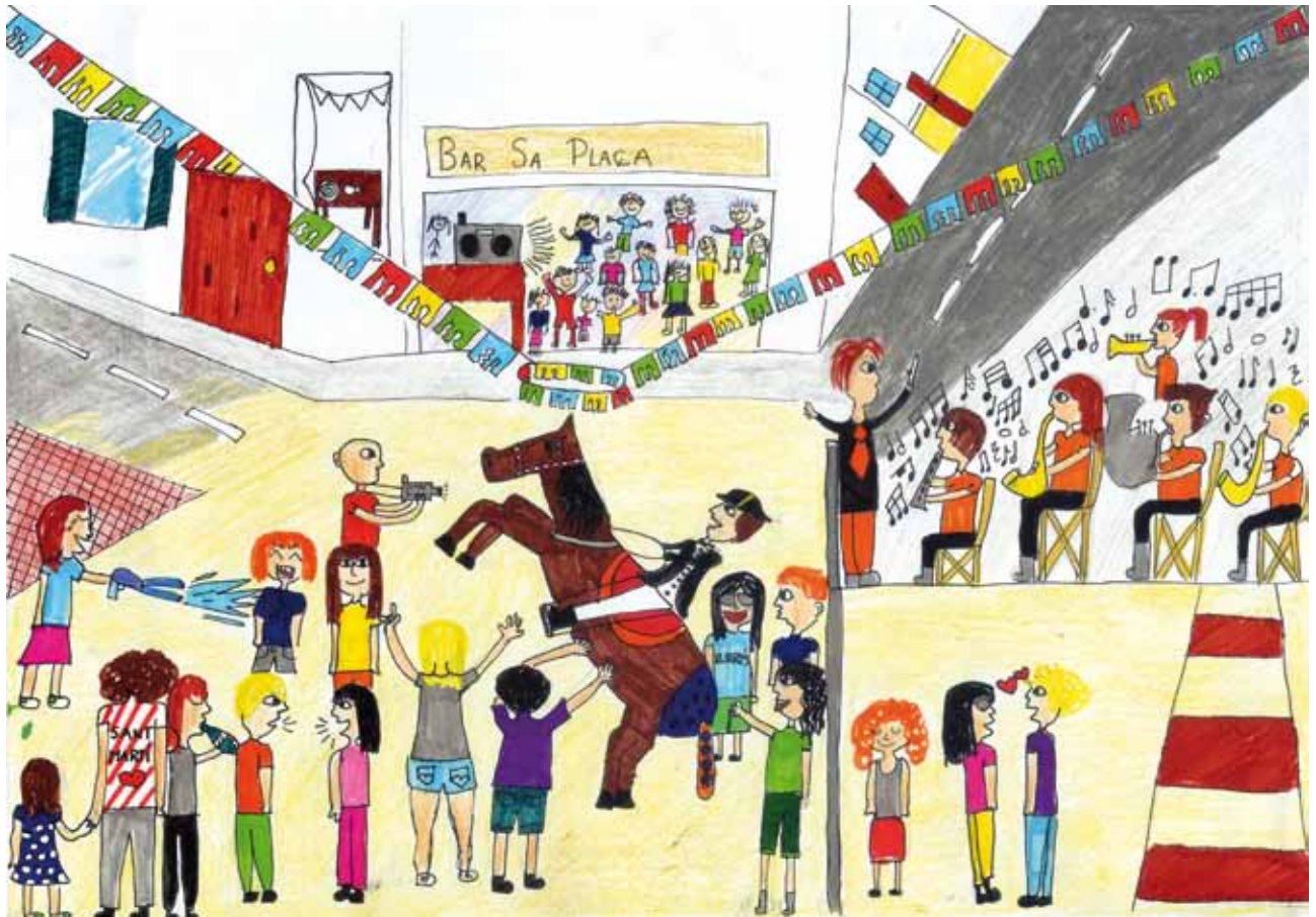
Èlia Castro Busom menció especial 6è curs