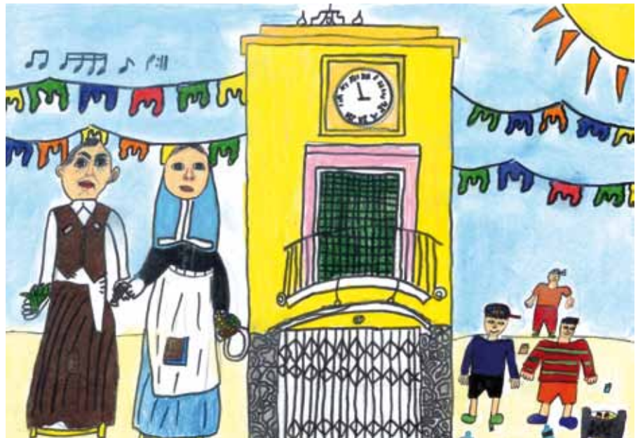
Genís Busom Castell menció especial 4t curs