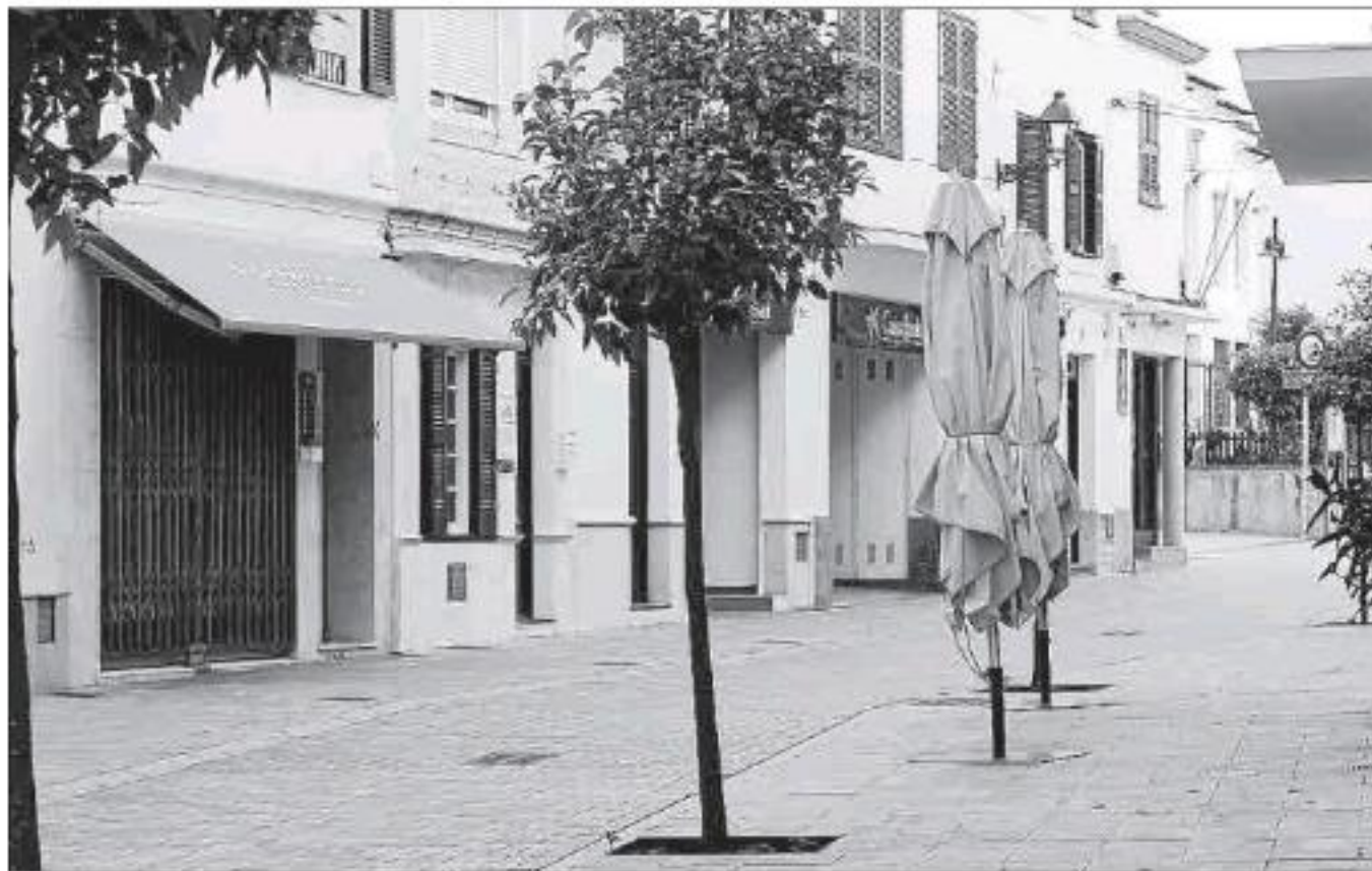
Las calles, vacías, no son buen compañero para el sector del comercio.