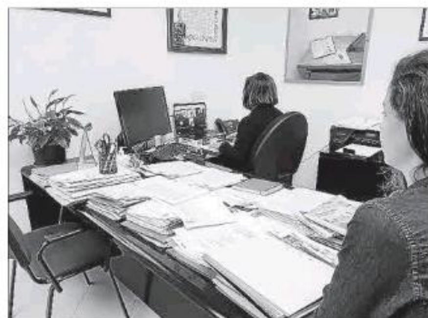
Encuentro telemático con los comerciantes, ayer.

El equipo de gobierno considera que con esta línea de subvenciones se