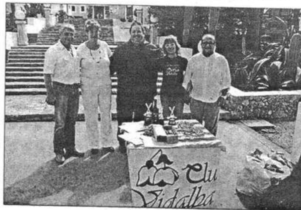
El evento fue organizado por la Logia Sol de Levante y Equelia.

Este fin de semana en las instalaciones de Sa Farinera de Es Mercadal ha tenido lugar un evento solidario con el Club Vidalba organizado por la Logia Sol de Levante 161 y la fundación Equelia. En este campeonato de minigolf participaron un total de 16 jóvenes discapacitados de la isla para recaudar fondos para la asociación. La fiesta culminó con una comida de hermandad.