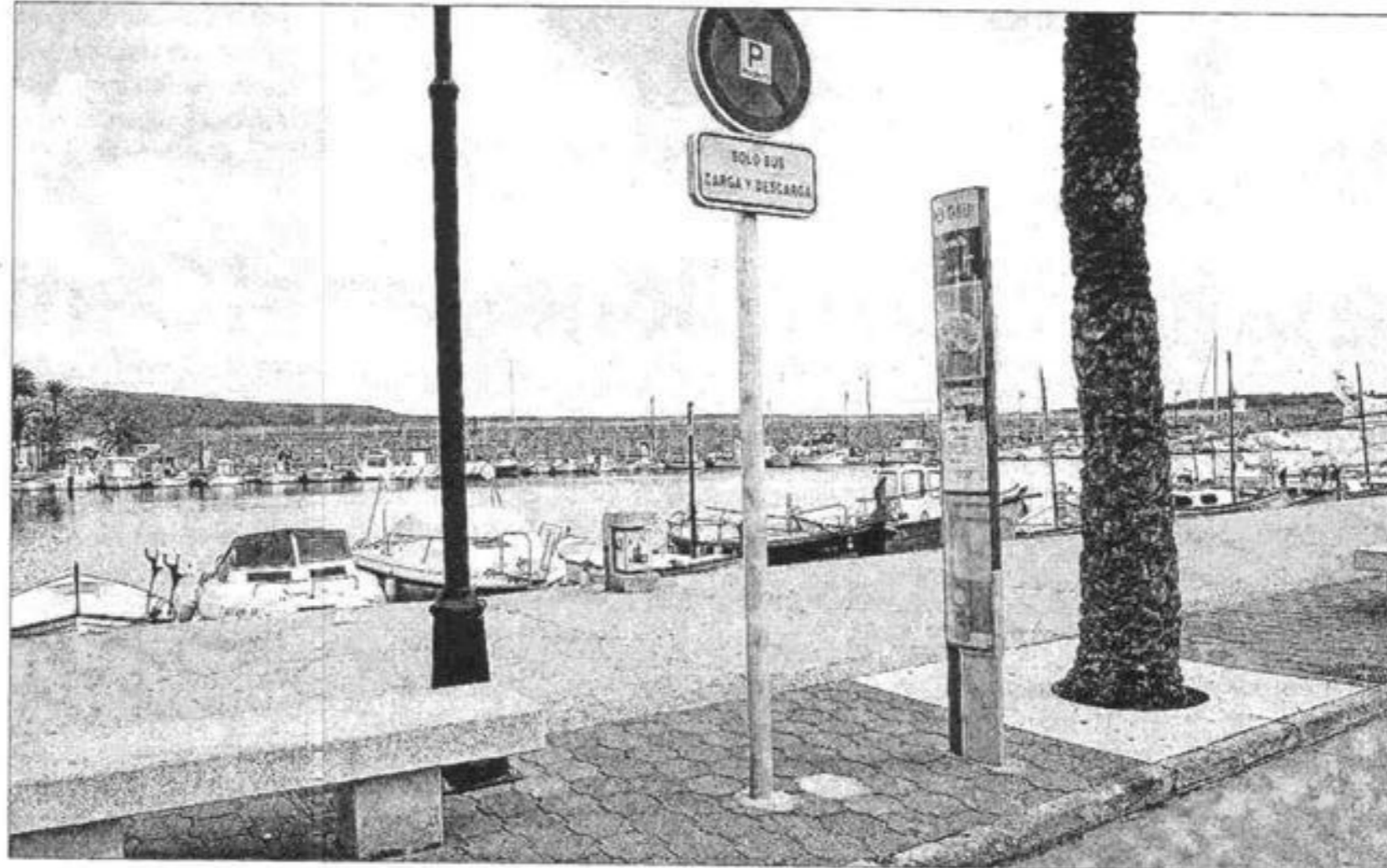
Imagen de la parada de autobús en el núcleo urbano de Fornells, al lado del puerto.

La conselleria de Mobilitat analiza si a partir del 2009 aumenta en al menos tres las frecuencias diarias