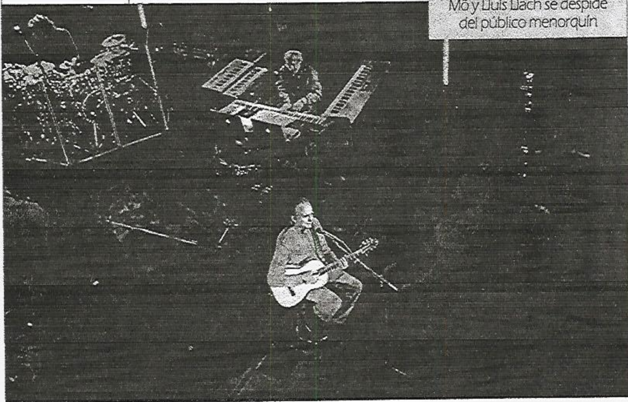
Joan Manuel Serrat ofreció el concierto en el Teatre Principal de Maó.

Joan Manel Serrat presenta en la isla su último disco Mó y Lluís Llach se despidió del público menorquín