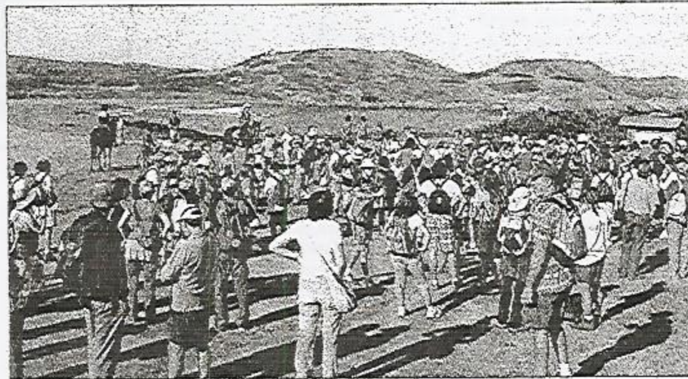
La Coordinadora en Defensa del Camí de Cavalls, ha retomado las excursiones reivindicativas.