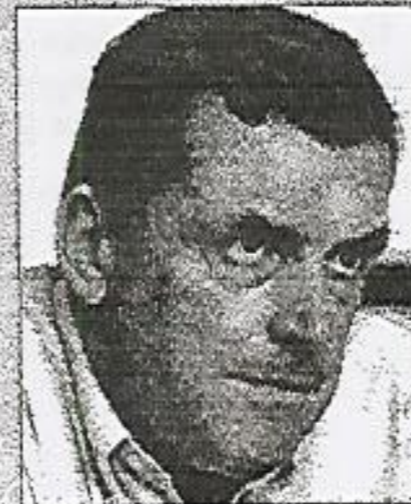
El senador José Seguí.

capital y demorar un día su regreso a la isla. Seguí cree «evidente que el augurio de Zapatero de que «el próximo año estaremos mejor» no ha durado ni 24 horas. Desde el PP llevamos tiempo denunciando que la actitud del Gobierno central no era la correcta, y los hechos así lo han corroborado. Las expectativas creadas no eran reales, pero lo que