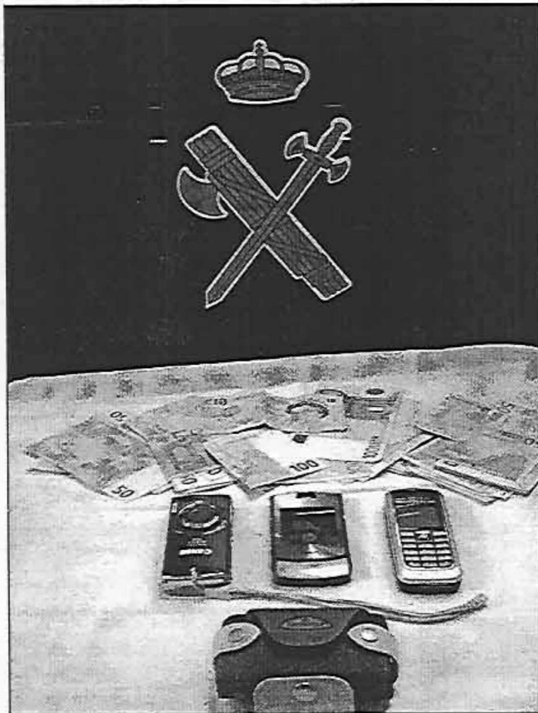
Se les intervino dinero, joyas y teléfonos móviles.