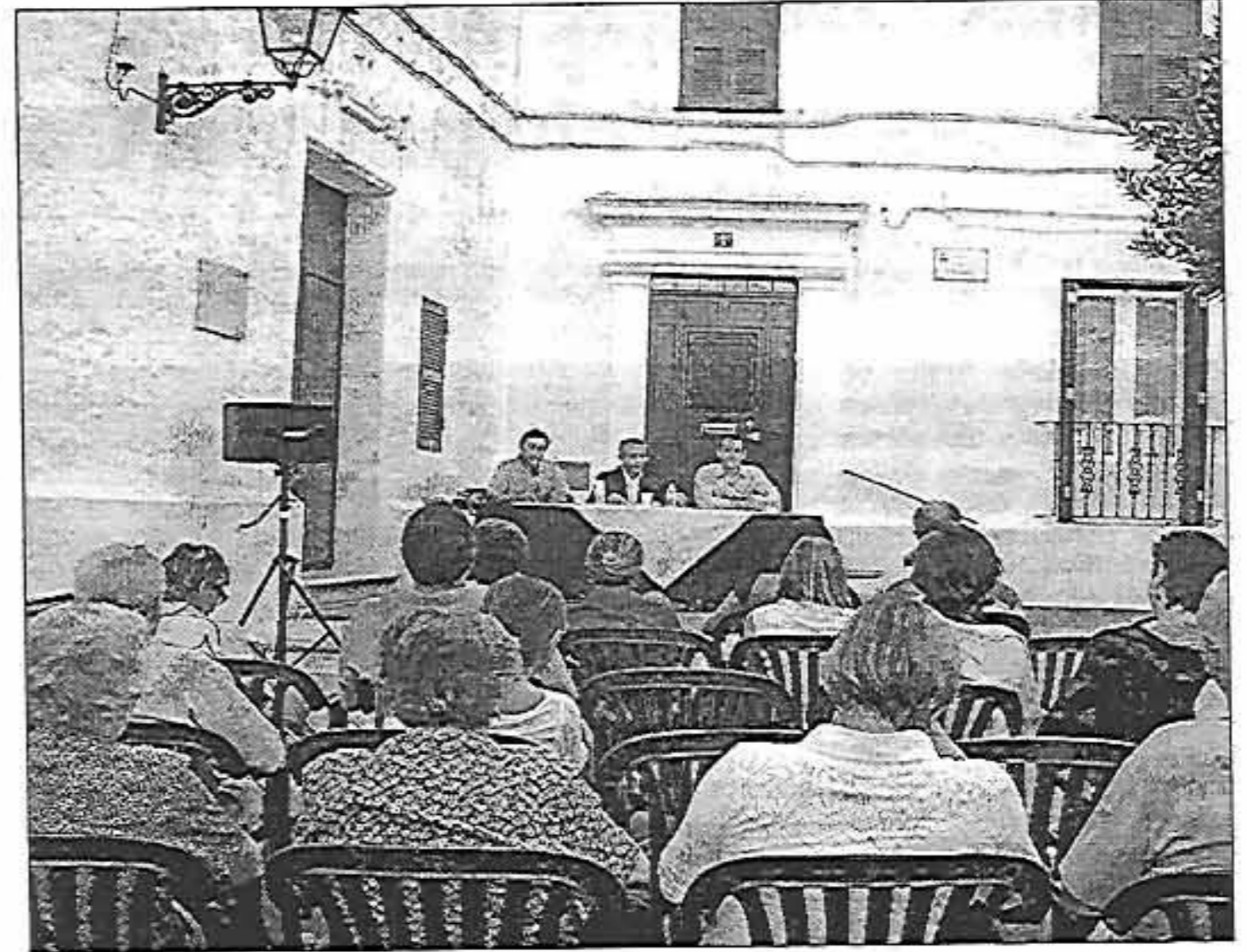
Las Tertúlias a la fresca de es Mercadal concluyeron ayer con el rector de la UIMP.

un modelo». Parejo también explicó que «posiblemente la UIMP traiga a Menorca algunos cursos puntuales, a poder ser sobre Medio Ambiente, por la Reserva de la Biosfera, y a poder ser en colaboración con la Universitat de les Illes Balears u otra que se pueda prestar a ello».